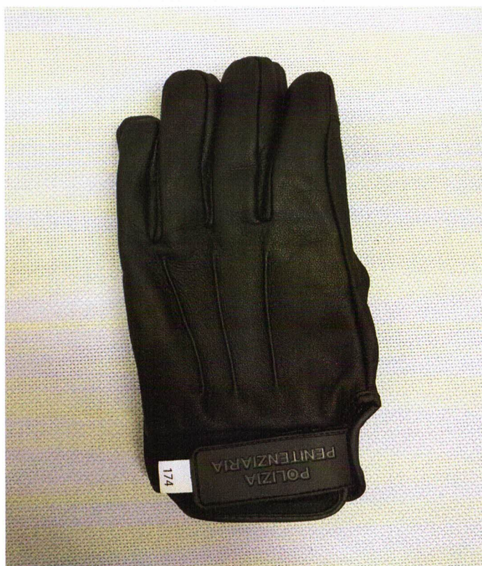
GUANTI OPERATIVI ANTITAGLIO IN SPERIMENTAZIONE

Sono concepiti quale DPI di seconda categoria, ai sensi del D.L.vo 475/1992 e conformi alle norme di riferimento UNI EN 388:2017, EN 420:2005+A1:2008, sono stati concepiti per resistere ad abrasioni (liv.3) , taglio da lama (liv. 5), strappo (liv.4) e perforazione (liv.4).