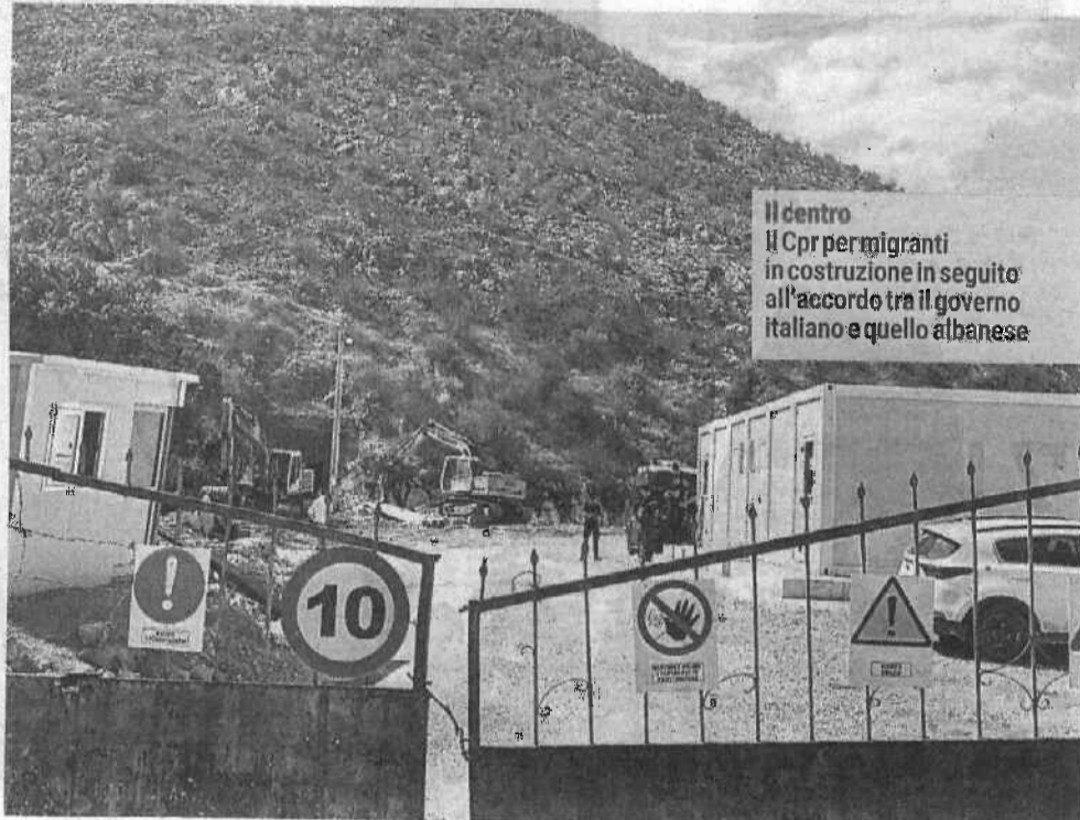
Il centro Cpr per migranti in costruzione in seguito all'accordo tra il governo italiano e quello albanese