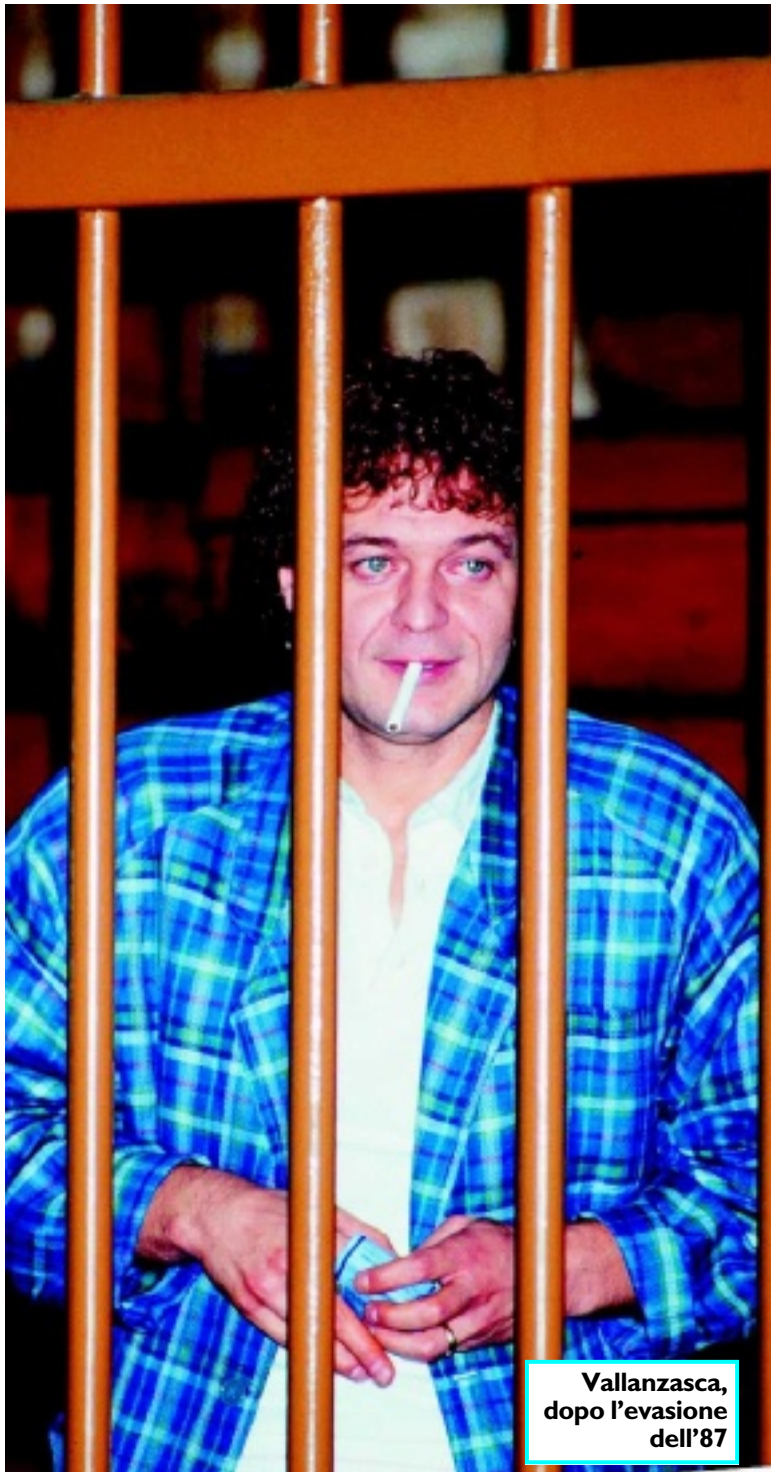
Vallanzasca, dopo l'evasione dell'87